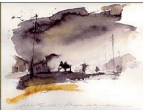
Letztes Tageslicht (Äthiopien)