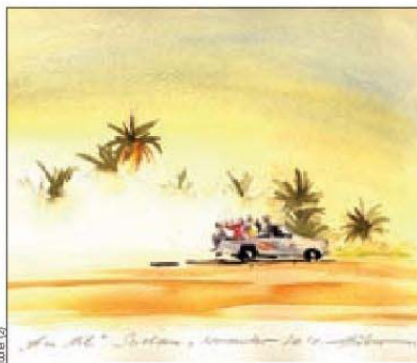
Am Nil (Sudan)

Fotografien und Zeichnungen aus Afrika, Ausstellung bis 16. September, Mo und Do 9-19 Uhr, Di und Mi 9-16 Uhr, Fr 9-13 Uhr, Sparda-Bank Erfurt